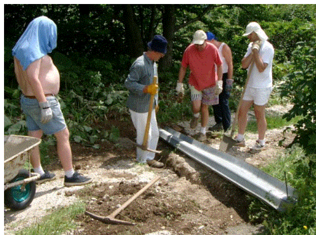
Prvi izmed štirih jarkov.