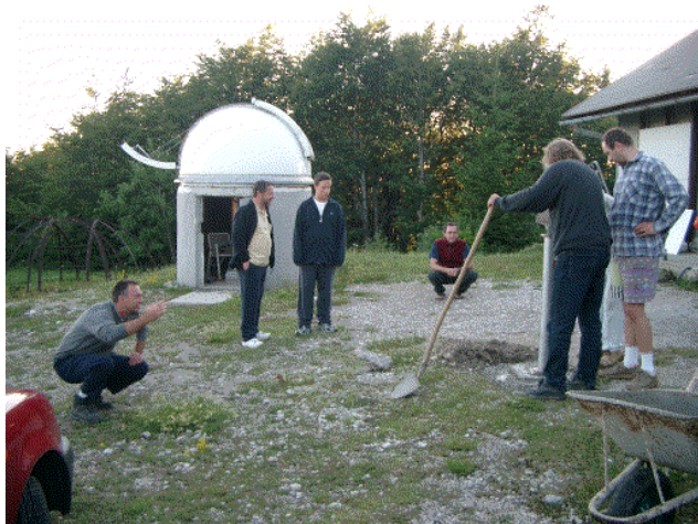
Vsi smo sodelovali pri določanju vertikale za teleskopski steber.