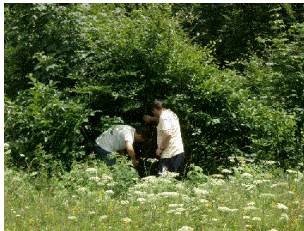
Družina Pucer se je lotila grmovja.